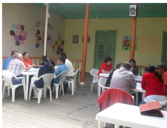
Taller con actores de la salud. Febrero 15 de 2012. Casa del adulto mayor