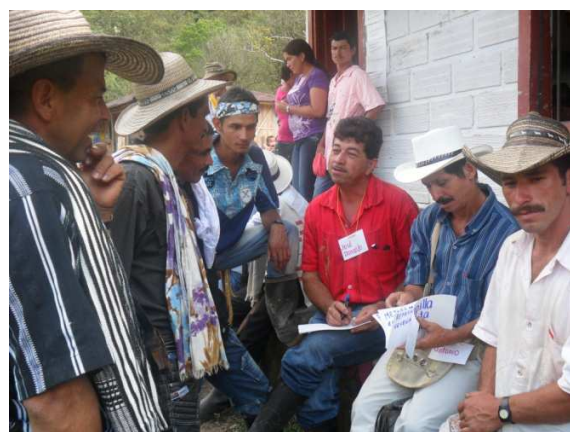
Taller comunidad corregimiento Rioverde de los Montes. Febrero 12 de 2012. Escuela vereda La Soledad

Tal como se plantea en la guía metodológica se propuso un ejercicio participativo, una construcción colectiva a partir de los principales problemas de los territorios o sectores. Se realizó la priorización, se avanzó en la identificación de causas y efectos y alternativas de solución para la transformación de las situaciones de mayor importancia. Lo anterior con el objetivo de discutir no solo las problemáticas sino también de construir y proponer alternativas de solución o transformación al tiempo que se reconocen las fortalezas y potencialidades de los habitantes y territorios del municipio.